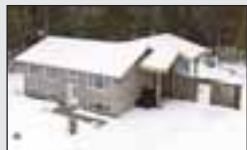
L'ISLE-AUX-ALLUMETTES (OUTAOUAIS) MLS 17197045 452,900 $