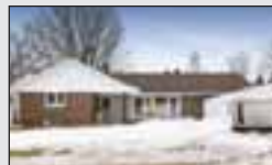
SHAWVILLE (OUTAOUAIS) MLS 25313852 380,000 $