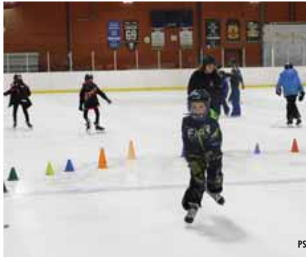
DWKS elementary students enjoy a free skate at the Upper Pontiac Sports Complex as part of the school's Carnival Week.