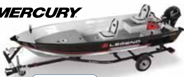
16 ProSport LS