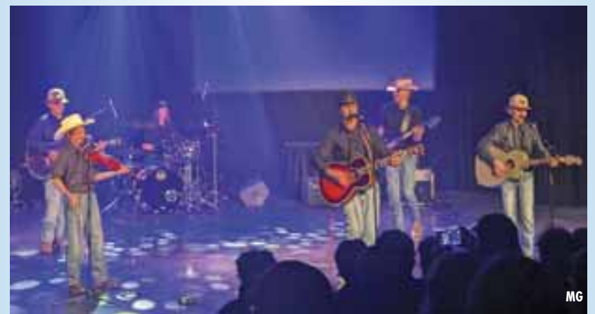
PHOTO : Des membres des « Les Carcajous du Nord » de l'ESSC lors de la finale régionale de Secondaire en spectacle à Gatineau, le 31 mars.

PONTIAC UNISSANT TOUT LE PONTIAC • UNITING ALL THE PONTIAC Journal DU PONTIAC