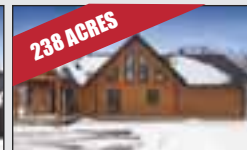
ÎLE-DU-GRAND-CALUMET (OUTAOUAIS) MLS 9434843 995,000 $