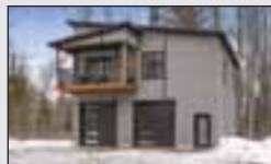
MANSFIELD-ET-PONTEFRACT (OUTAOUAIS) MLS 17100336 349,900 $