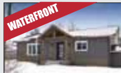
FORT-COULONGE (OUTAOUAIS) MLS 19586547 379,900 $