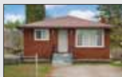
BRYSON (OUTAOUAIS) MLS 16125022 199,900 $