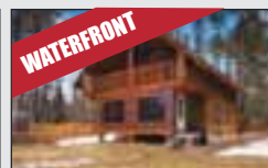
MANSFIELD-ET-PONTEFRAC (OUTAOUAIS) MLS 24680729 359,000 $