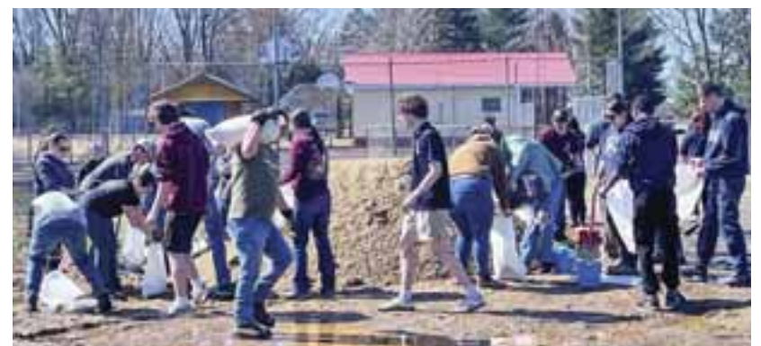
Des élèves et membres du personnel de l'ESSC remplissent des sacs de sable au Patro à Mansfield. (ESSC)

PONTIAC UNISSANT TOUT LE PONTIAC • UNITING ALL THE PONTIAC Journal DU PONTIAC