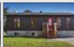
SHAWVILLE (OUTAOUAIS) MLS 21257367 299,000 $