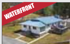
PORTAGE-DU-FORT (OUTAOUAIS) MLS 13079599 475,000 $