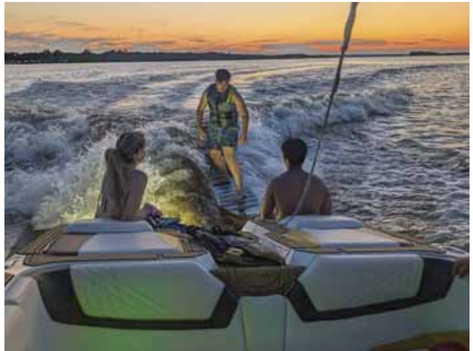
A participant enjoys an evening wakensurfing session on the Ottawa River during a Griff Slaughter Experience excursion. GSX offers guided river tours, watersports and private charters throughout the Ottawa Valley.