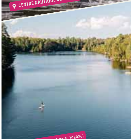
📍 CHALETS PRUNELLA (ENR. 308026)