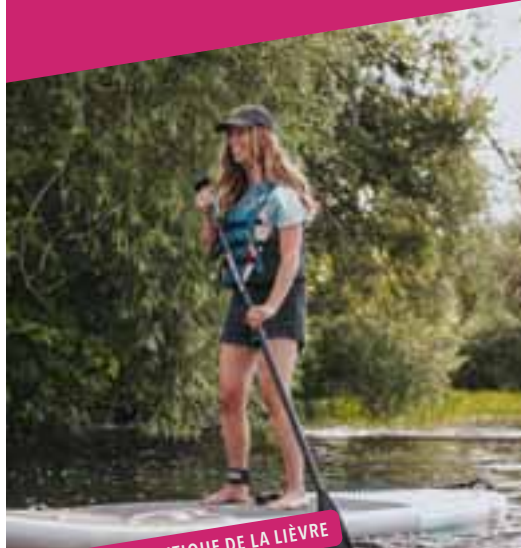
📍 CENTRE NAUTIQUE DE LA LIÈVRE