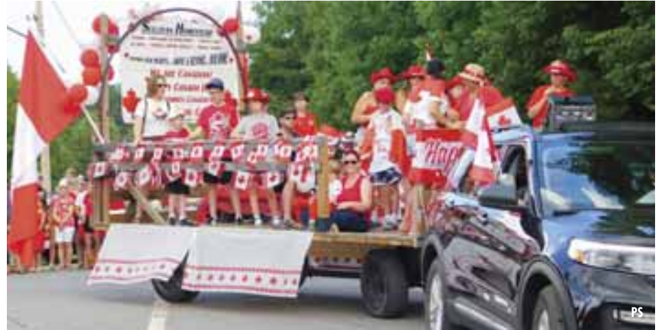
A float decorated in red and white makes its way through Sheenboro during the annual Canada Day parade, the highlight of a community celebration that has been a local tradition for more than 30 years.

Many hands make light work, and that spirit of volunteerism is evident throughout the Canada Day celebration.