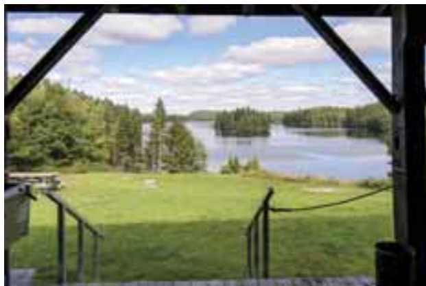
The view of Sheen Lake from the deck of Dark Horse Hideaway lodge at Brennan's Recreational Farms.