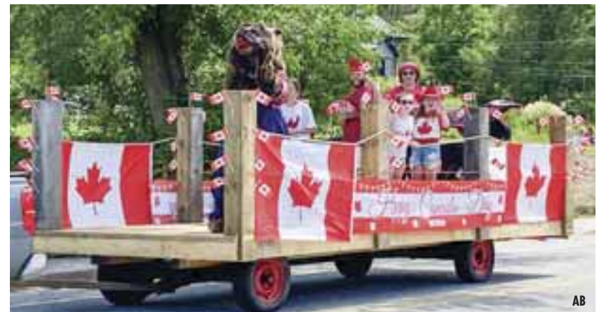
PHOTO : Un char allégorique défile dans les rues d'Otter Lake lors du défilé de la fête du Canada de l'an dernier. Le défilé de cette année débutera à 14 h le 1er juillet.

La journée se terminera au crépuscule avec un feu d'artifice au terrain récréatif. Les organisateurs indiquent que le spectacle aura lieu beau temps, mauvais temps.