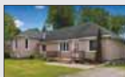
SHAWVILLE (OUTAOUAIS) MLS 15455659 378,000 $