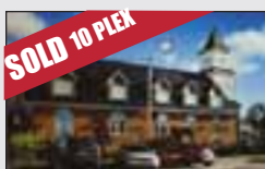
SHAWVILLE (OUTAOUAIS) MLS 24049181