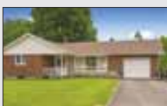
SHAWVILLE (OUTAOUAIS) MLS 26020335 369,900 $