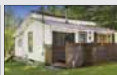
CLARENDON (OUTAOUAIS) MLS 10395356 135,000 $