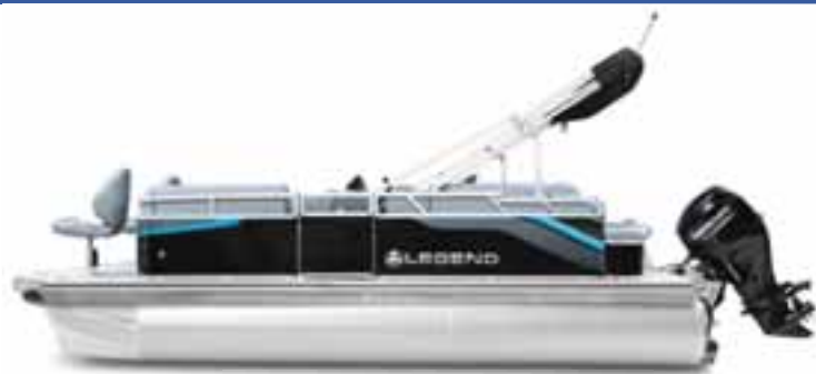
LE 19 RS-EXT Legend, blue