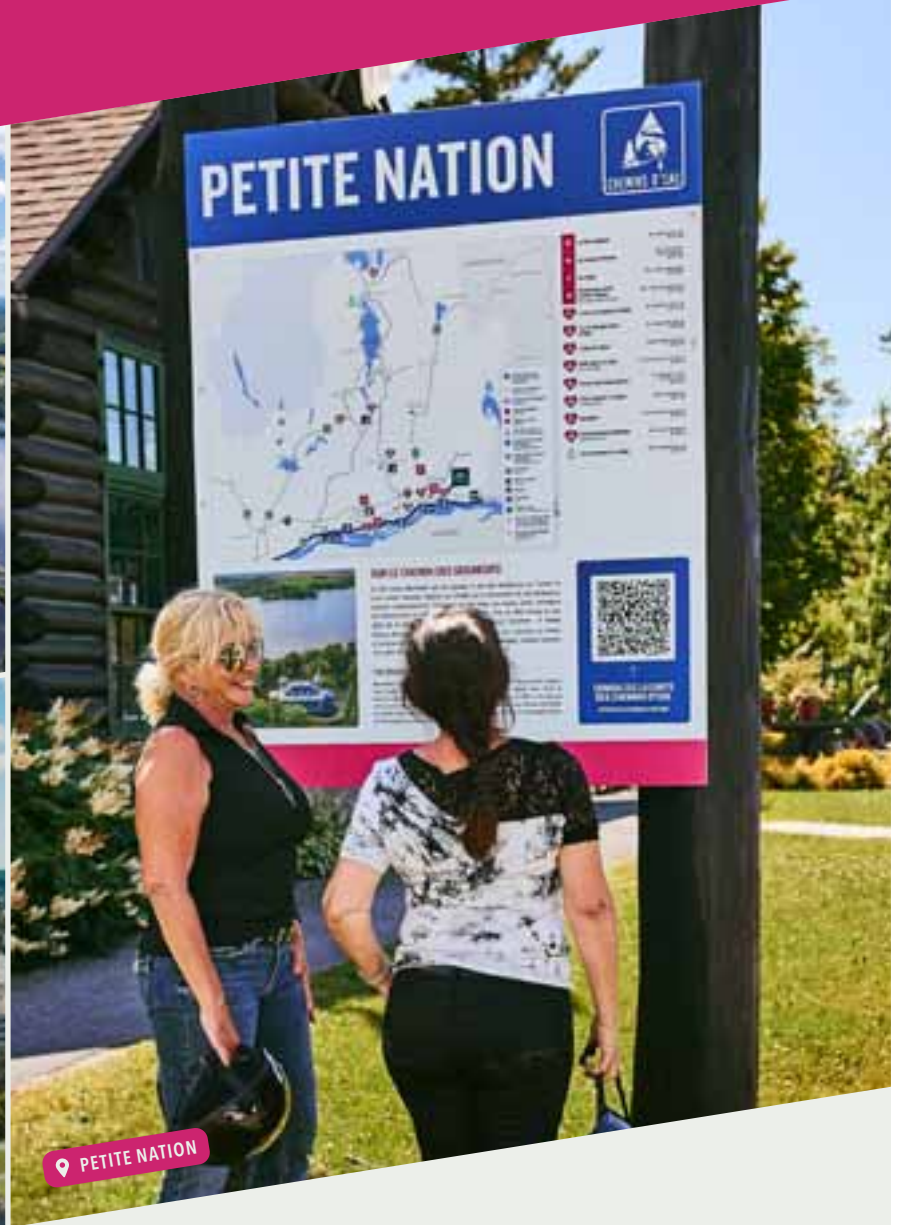
📍 PETITE NATION

EXPLOREZ LES CHEMINS D'EAU TOURISMEOUTAOUAIS.COM