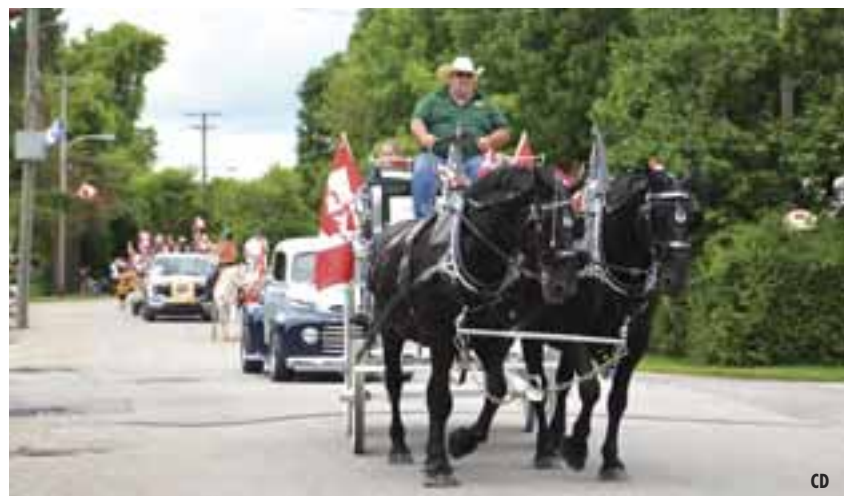
Un chariot tiré par des chevaux participe au défilé de la fête du Canada 2025 à Shawville. Le défilé sera de retour le 1er juillet dans le cadre d'une journée d'activités comprenant un déjeuner communautaire, un marché, une course de boîtes à savon et un feu d'artifice.

Le défilé annuel de la fête du Canada s'élancera à 13 h dans le centre-ville de Shawville. Les entreprises, groupes agricoles et organismes communautaires sont invités à participer, et des prix seront remis aux meilleurs chars allégoriques. Les inscriptions à l'avance seront acceptées à l'hôtel de ville jusqu'au 28 juin. L'inscription et le rassemblement le jour même débuteront à 11 h 30 chez Autobus LaSalle, sur la rue West.