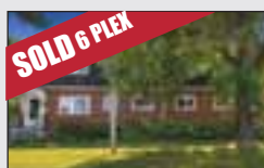
SHAWVILLE (OUTAOUAIS) MLS 10527921