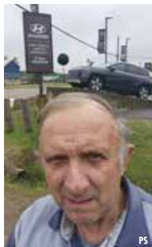
PHOTO: A returning customer visits Hyundai Pembroke during the dealership's Hyundai Sunday promotion.