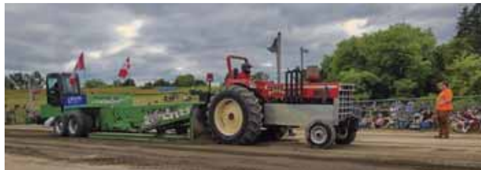
A competitor powers down the track during last year's truck and tractor pull at the Eganville Sno-Drifters Club. The event returns June 27 and 28 with truck, tractor and lawn tractor pulls, a demolition derby and family activities.