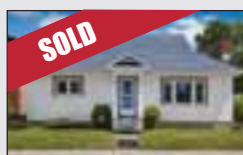
SHAWVILLE (OUTAOUAIS) MLS 12687406 220,000 $